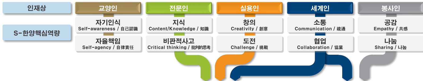
문제 해결 CLUSTER