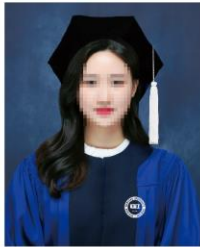
학사모 촬영 (30-40분)