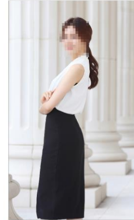
야외프로필 촬영 (20-30분)