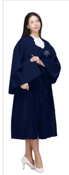
실내프로필 촬영 (20-30분)