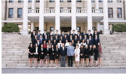
단체사진 (10-15분) 단체촬영을 희망하는 학과 는 5월20일~22일 사이 학과대표님이 카카오톡 pusannalla 으로 신청