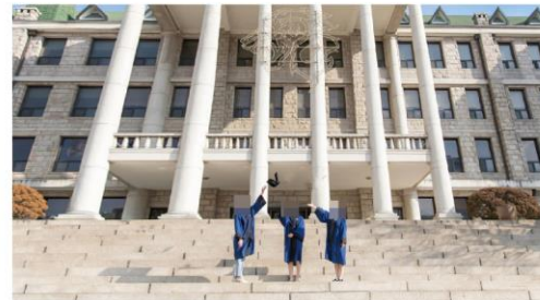
희망자에 한해 우정사진 촬영 (20-30분) 야외 또는 실내 중 선택 하실 수 있습니다. (촬영현장에서 말씀 하시면 됩니다)